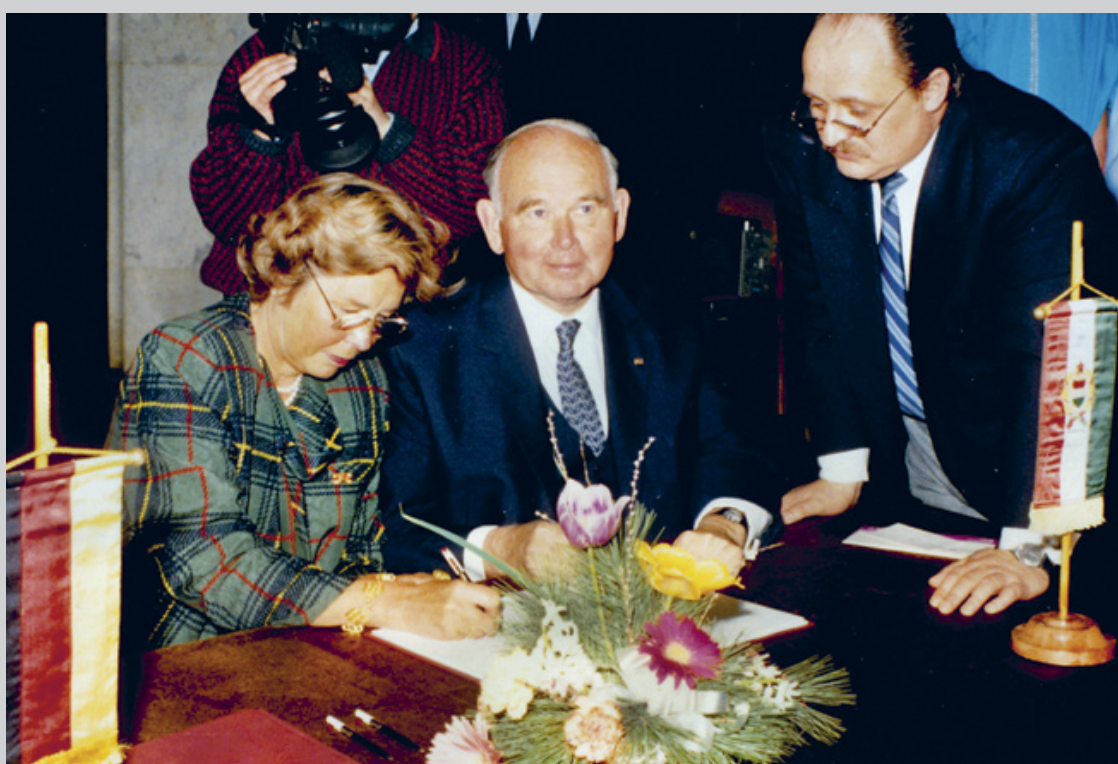
A magyarországi Ludwig Múzeum megalapításáról szóló szerződés ünnepélyes aláírása, 1989. március 21. Ceremonial signing of the convention on the foundation of Ludwig Museum in Hungary, 21 March 1989

On 21 March 1989, a little after the opening of the exhibition of Hungarian artists in Aachen, the founding contract of the Ludwig Museum in Hungary was ceremoniously signed in Budapest. The signers were Peter and Irene Ludwig and the Ludwig Stiftung of Aachen on the German side, and the Minis-