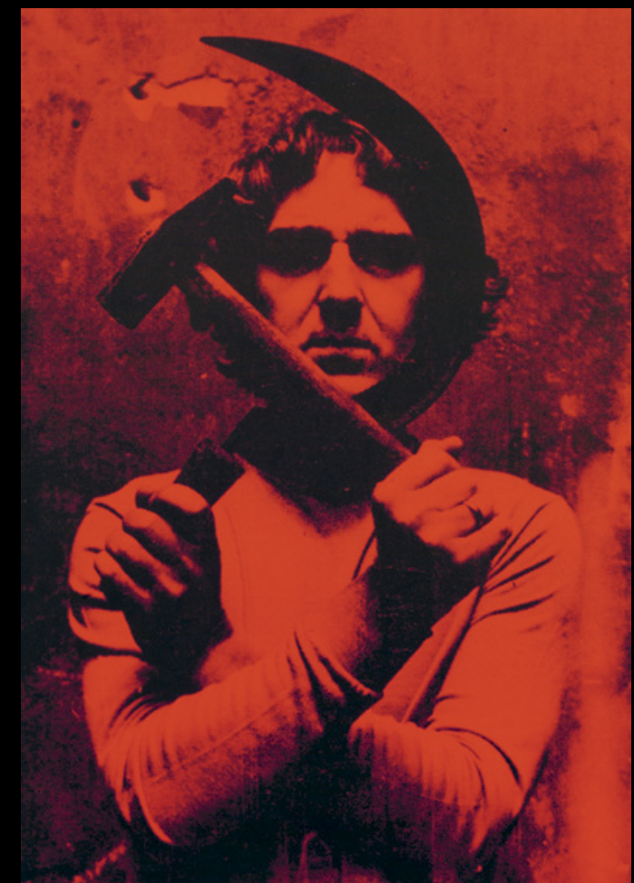
Pinczehelyi Sándor: Sarló és kalapács | Hammer and Sickle , 1973 – 1987

FROM 14 NOVEMBER 2014 LUDWIG MUSEUM – MUSEUM OF CONTEMPORARY ART THE NEW PERMANENT EXHIBITION OF THE 2014. NOVEMBER 14-TŐL MÚZEUM ÚJ ÁLLANDÓ KIÁLLÍTÁSA A LUDWIG MÚZEUM – KORTÁRS MŰVÉSZETI The contemporary collection A kortárs gyűjtemény LUDWIG 25