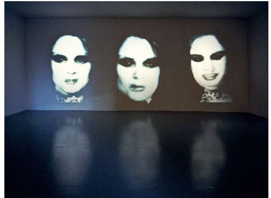
Transformer 1973/74 8 dia / 8 Slide Projections © Katharina Sieverding, Klaus Mettig, VG Bild-Kunst

A Klaus Mettiggel közösen készített Motorkamera- illetve Transformer-sorozat (1973/74) a nemi identitás problematikájával függ össze: a Transformerben egymásra vetített arcképek végeredménye az androgün „állapot” utáni vágy megtestesülése. Amikor a nemek közti különbségek hangsúlyozása uralta a gondolkodást, ez a munka a kötött nemi szerepek alól való felszabadulást, a nemi szerepek közti átjárhatóságot demonstrálta. A '90-es években készült Kristallisationen és a Steigbilder-sorozat az ember, a természet biológiai, organikus „lényegét” az orvostudomány eszközeivel és eljárásaival mutatja be, gyakorlatilag ornamentalsként, díszítőelemként, nem utolsó sorban ily módon is felvetve az identitás, a meghatározottság és az ellenállás kérdéseit.