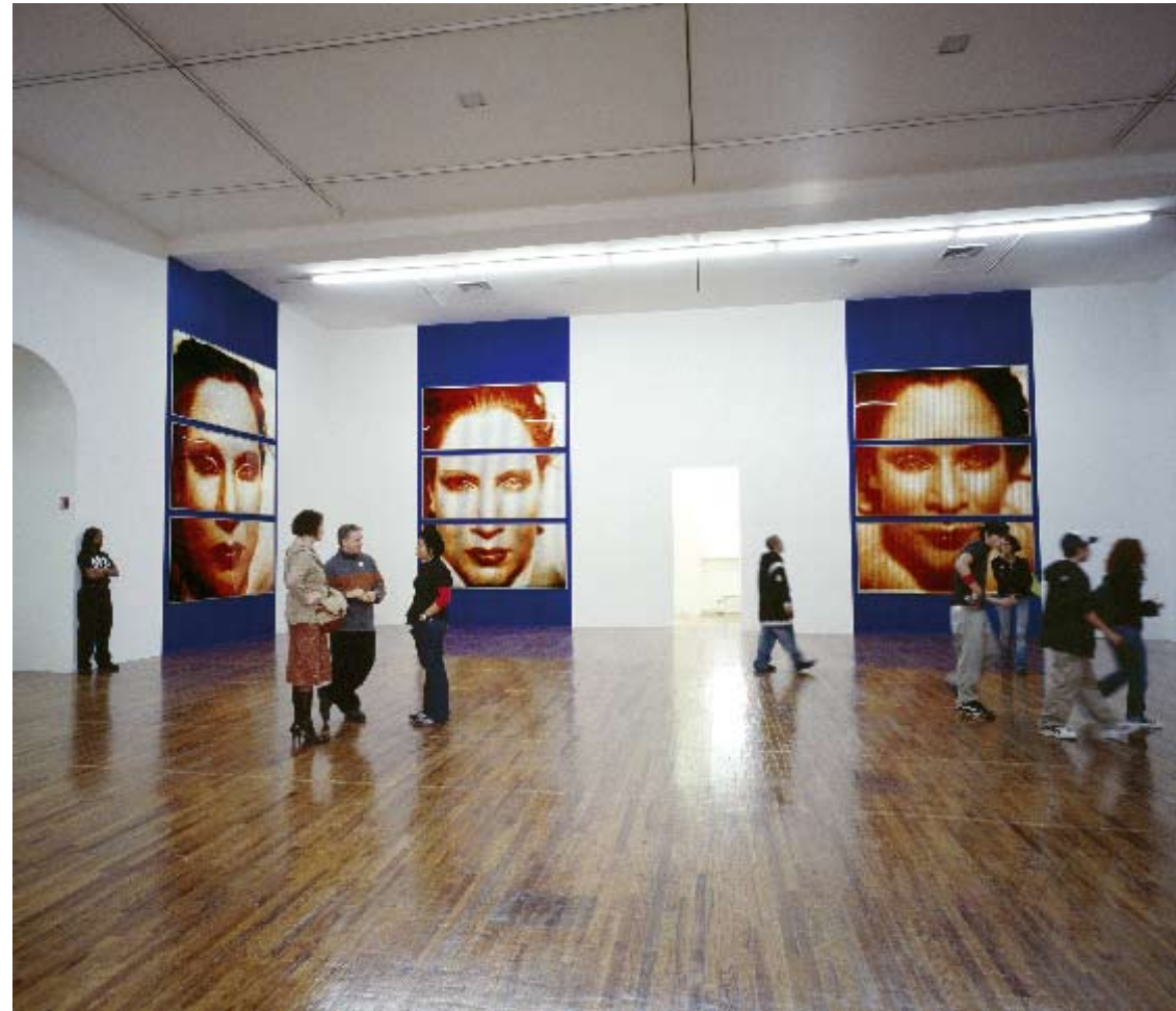
Ultramarine I-VI 1993 C-print, akril, acél, murális festmény C-print, acrylic, steel, mural painting 125x300 cm egyenként/each © Katharina Sieverding, Klaus Mettig, VG Bild-Kunst