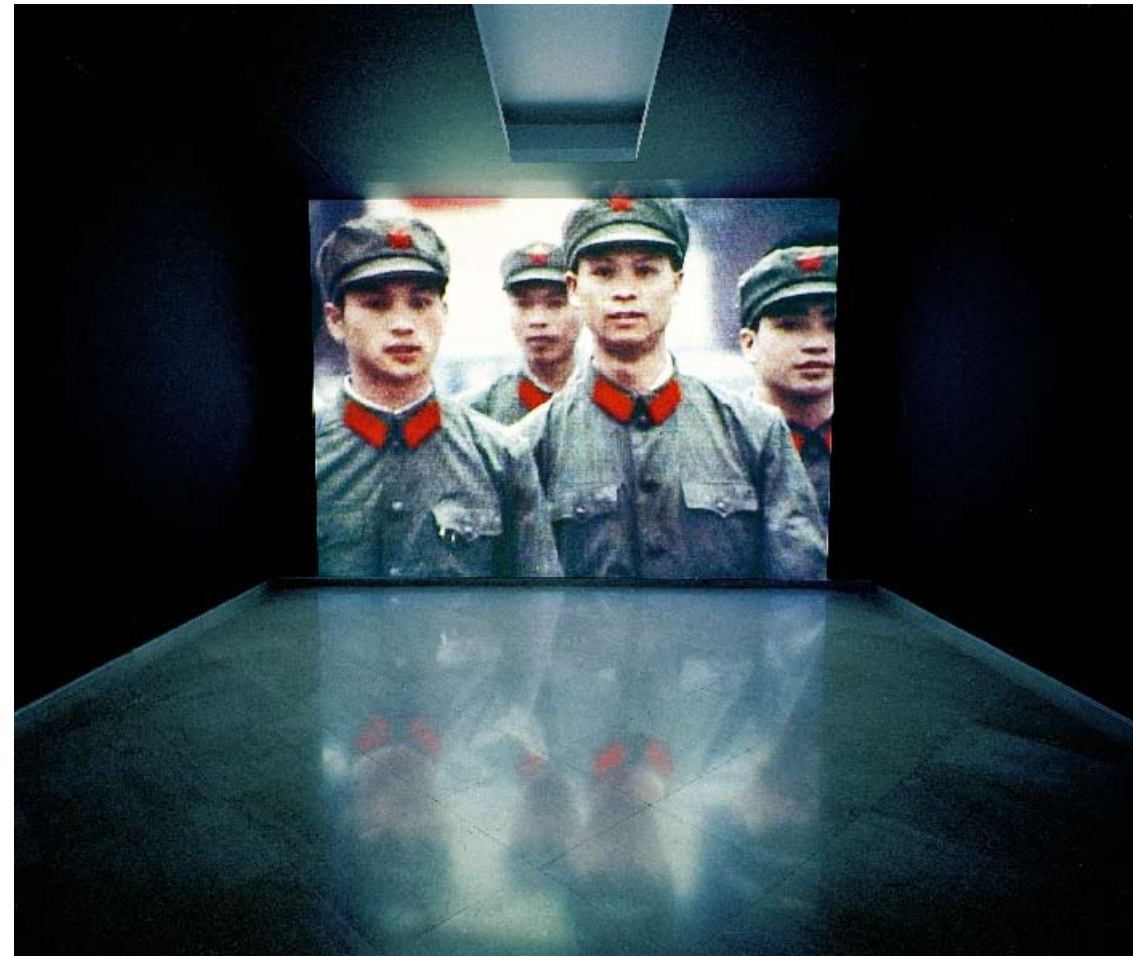
China, September – October 1978 Beijing, Yanan, Xian, Luoyang Peking, Yanan, Xian, Luoyang DVD/DVD projection 2h 20m 39s © Katharina Sieverding, Klaus Mettig, VG Bild-Kunst