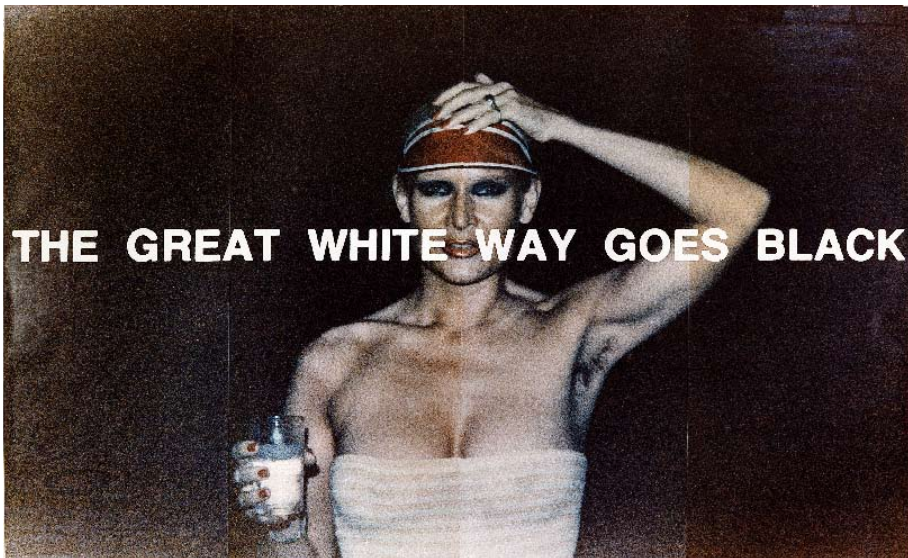
The Great White Way Goes Black IX/77 1977