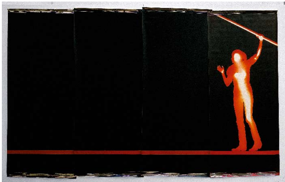
XVII/1980 digitális vetítés / digital projection © Katharina Sieverding, Klaus Mettig, VG Bild-Kunst

The Motorkamera and the Transformer series (1973/74), created in collaboration with Klaus Mettig, relate to the issue of sexual identity. In Transformer , the portraits projected onto one another result in the embodiment of a longing for an androgynous "state". At a time when the general sentiment and thinking was dominated by an emphasis on the differences between the sexes, this work demonstrated liberation from the defined sexual roles and the permeability between the sexes. The series Kristallizationen and Steigbilder of the nineties present the biological and organic "essence" of humans and of nature by applying the processes and tools of medicine practically as an ornament, as another way of reflecting on the issues of identity, determination and resistance.