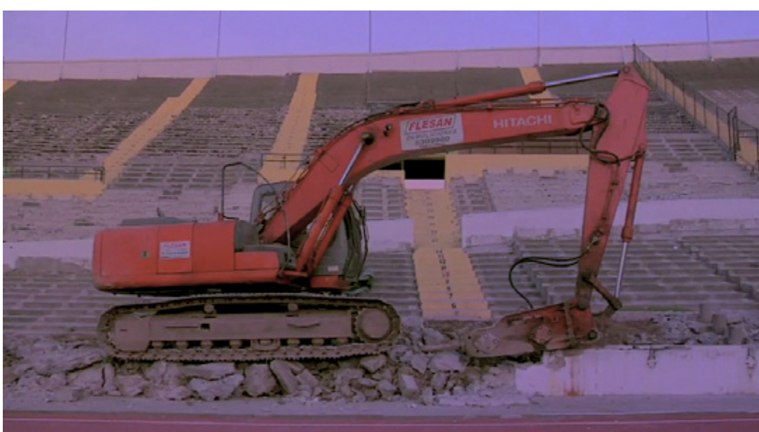
Camilo Yáñez: Estadio nacional 11.09.09 , 2010, részlet | video still: © Camilo Yáñez