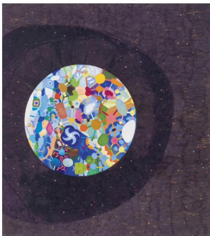
BAKSA-SOÓS János: Zászló | Flag akril, vászon | acrylic on canvas, 1999

A kiállítás apropóját nemcsak a vasfűgöny leomlásának idén ünnepelt 25. évfordulója adja. Fontos inspirációt jelent a kortárs művészet folyamatos önrreflexiója, amely azt vizsgálja, elindítja-e a művészet lényeges társadalmi, politikai változásoknak, vagy inkább reagál rájuk. Az Anarchia, Utópia és Forradalom fejezetek, mint egy egyenlő oldalú háromszög elemei jelölik ki a kiállítás értelmezési keretét. A Magyarországon eddig még nem vagy ritkán látott művek mellett a Ludwig Múzeum – Kortárs Művészeti Múzeum gyűjteményének számos darabja is szerepel a kiállításon. Erre az alkalomra került rekonstruálásra a Hejettes Szomlyazók csoport 1989-ben Nyugat-Berlinben, a Künstlerhaus Bethanienben bemutatott installációja, az A oltár.