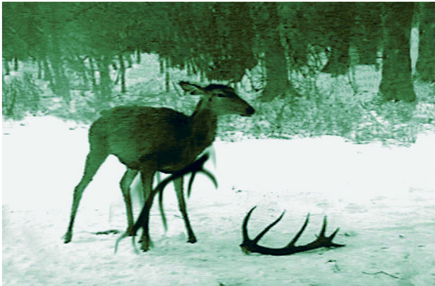
APSOLUTNO: Atrófia | A.trophy, állókép | video still, 2002 © Zoran Pantelic

valamint művek a Ludwig Múzeum gyűjteményéből | and works from the collection of the Ludwig Museum BÓDY Gábor, FREY Krisztián, GULYÁS Gyula, SZOMBATHY Bálint