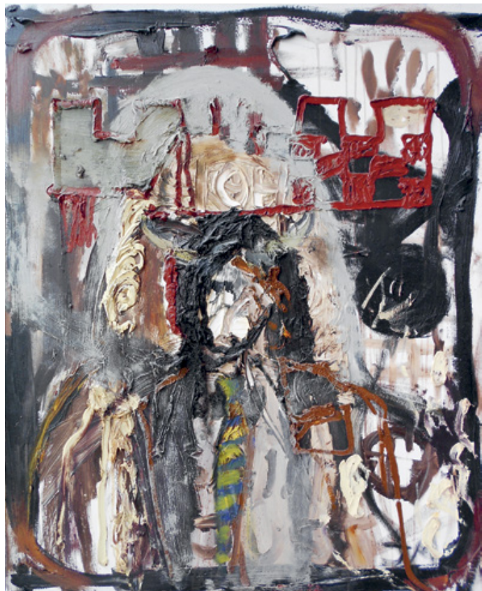
Jonathan MEESE: Bivalyszőr anyja | Mutter Büffelhaar, olaj, vászon | oil on canvas, 2001

Az időben a nyolcvanas évektől egészen napjainkig ivelő időszakot átfogó, térben pedig döntően Kelet-Közép-Európára fókuszáló kiállítás a címében megfogalmazott forradalmi gondolatot a kortárs képzőművészet egyes markáns pozícióin keresztül igyekszik feldolgozni.