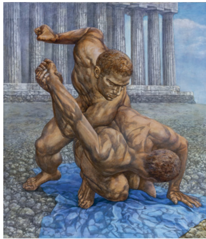
G. GURJANOV: Cim nélkül (Birkózók) | Untitled (Wrestlers) , 1992–2005 akril – vászon | acrylic on canvas – 150×130 cm

A kiállítás az UVG art gallery (Jekatyerinburg – Budapest) együttműködésével jött létre | www.uralvisiongallery.com