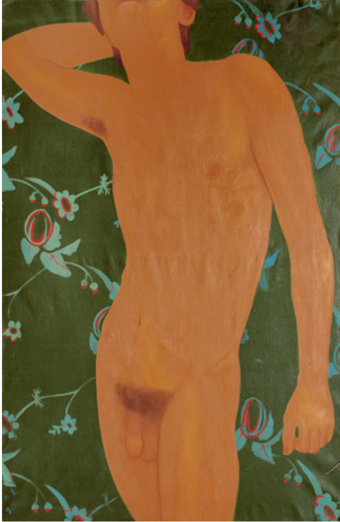
D. EGELSZKIJ | D. EGELSKY: Cim nélkül | Untitled , 1990 olaj – vászon | oil on canvas – 150×100 cm

A kiállítás kurátorai: Jekatyerina ANDREJEVA, Andrej HLOBISZTYIN