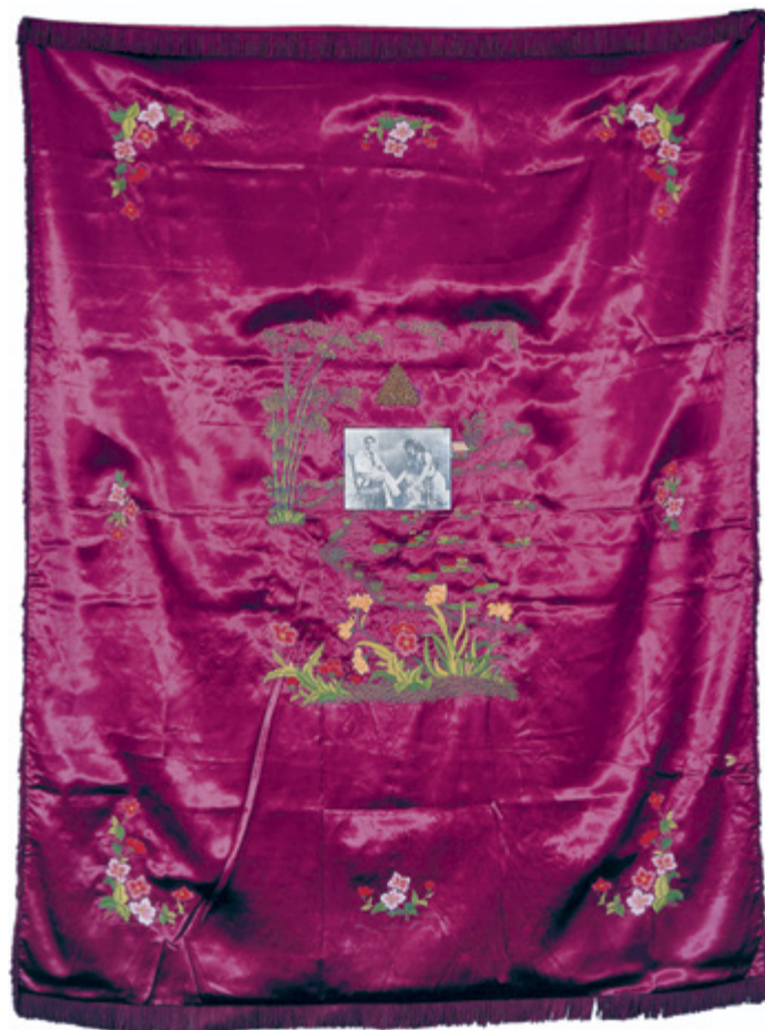
T. NOVIKOV: Szalomé | Salome , 1992/1993 textil, fotográfia | textile, photography, gold braid – 218×166 cm

The emergence of the New Academy, the goals and works of the group generated fervent debates and misinterpretations for a long time, dividing not only the Russian audience. In the mean-